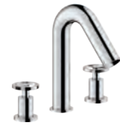
3-hole set Batteria 3 fori