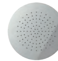
Flush-fit shower head \varnothing 380 mm Soffione a incasso \varnothing 380 mm