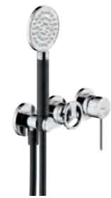
2 ways flush-fit single control Monocomando incasso a 2 vie