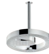
Shower arm, shower head \varnothing 290 mm Braccio doccia, soffione \varnothing 290 mm