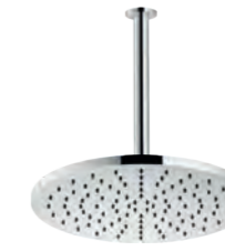
Shower arm, shower head \varnothing 300 mm Braccio doccia, soffione \varnothing 300 mm