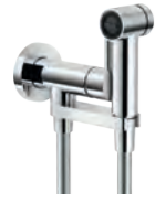
Flush-fit single control Monocomando incasso