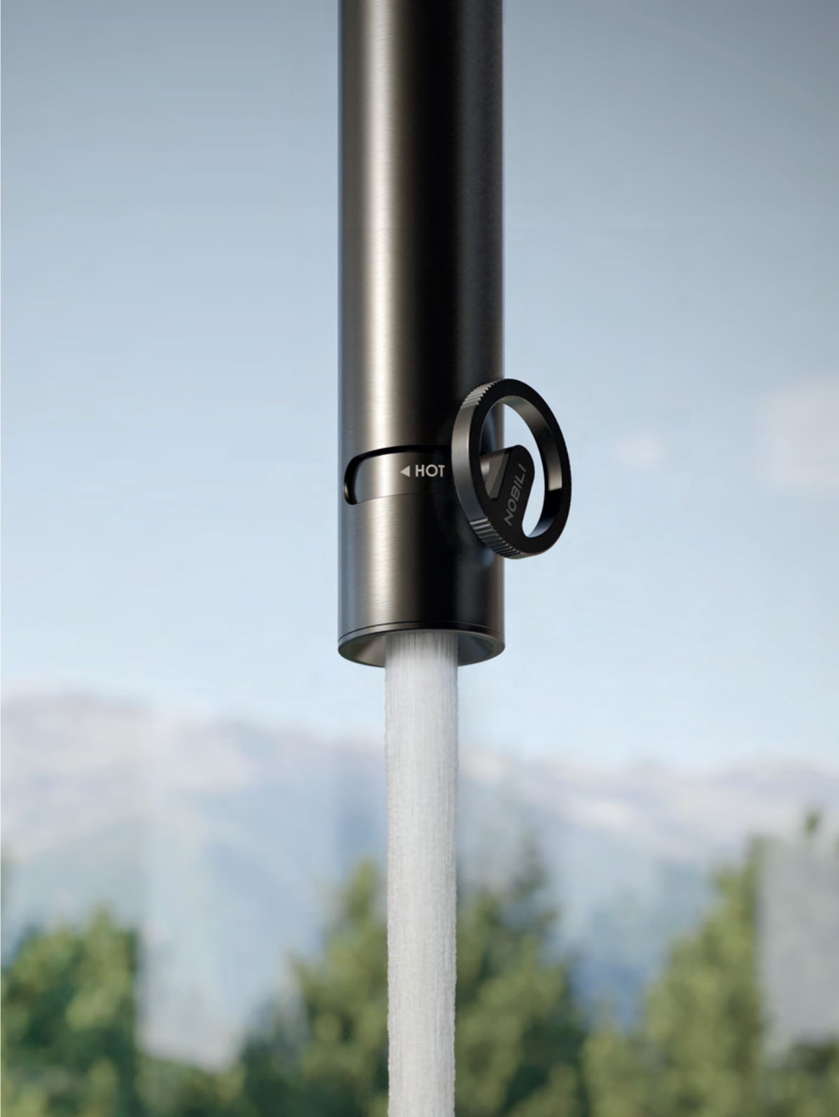
SO130318/3EGUP Ceiling-mounted washbasin mixer