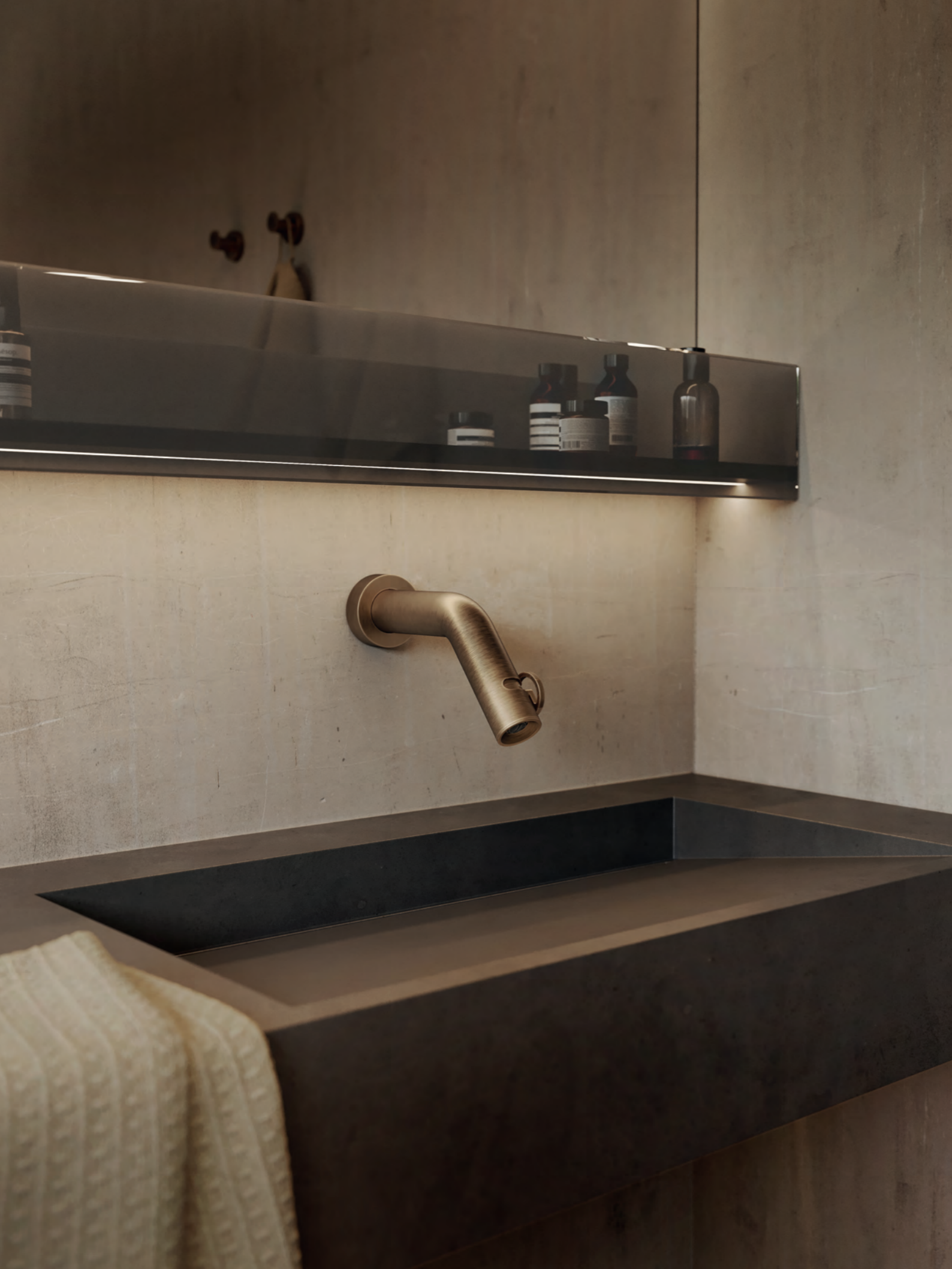
SO130198SB Wall-mounted washbasin mixer