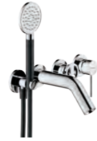
2 ways flush-fit single control Monocomando incasso a 2 vie