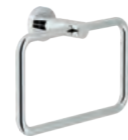
Towel holder 210 mm Porta salvietta 210 mm