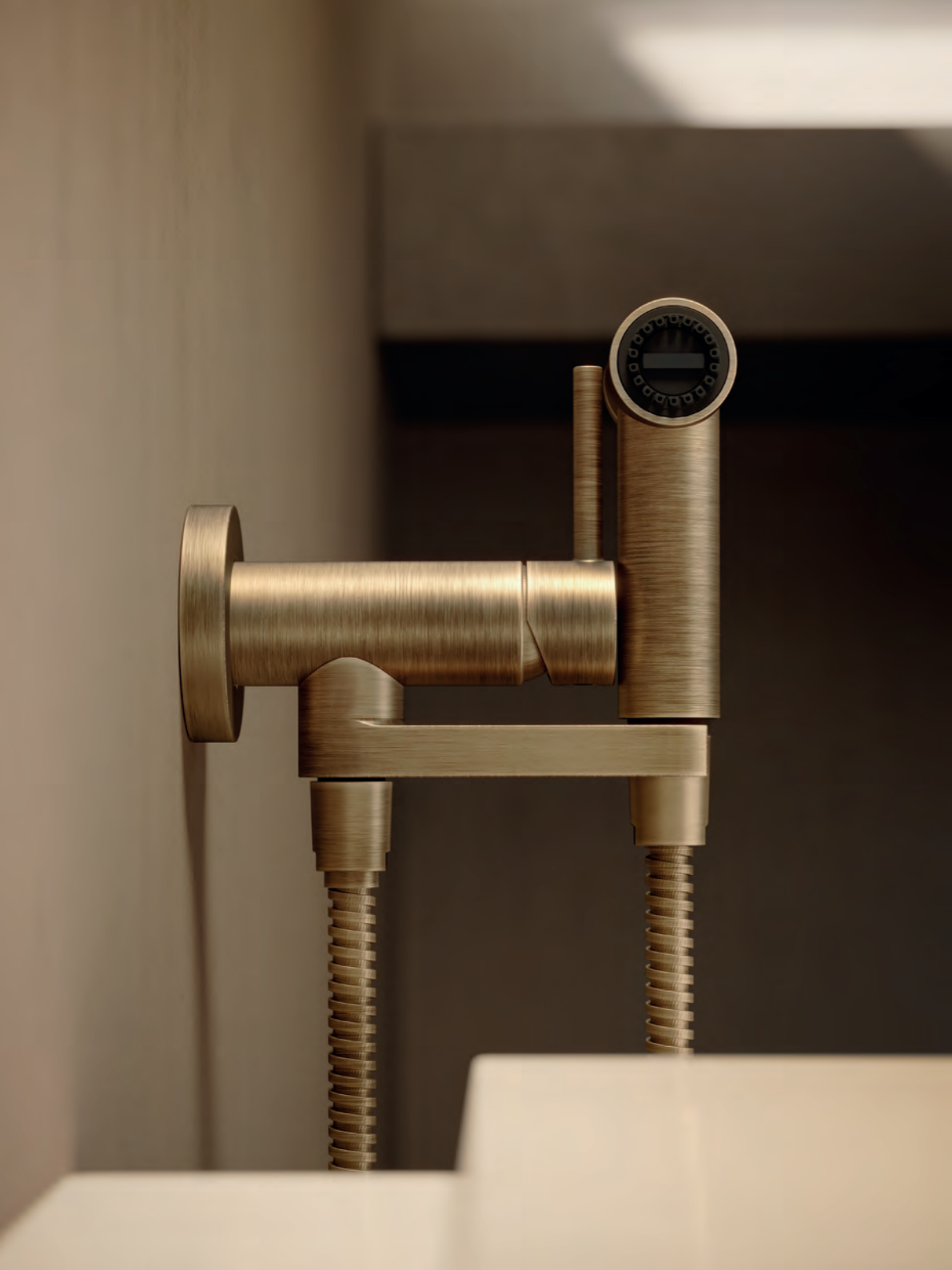
AV006005B Flush-fit shower wc