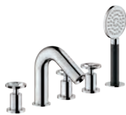
Deck-mounted 5-hole set Batteria 5 fori bordo vasca