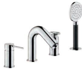
Deck-mounted single control Monocomando bordo vasca