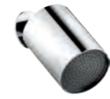
Wall-mounted shower head Soffione a parete