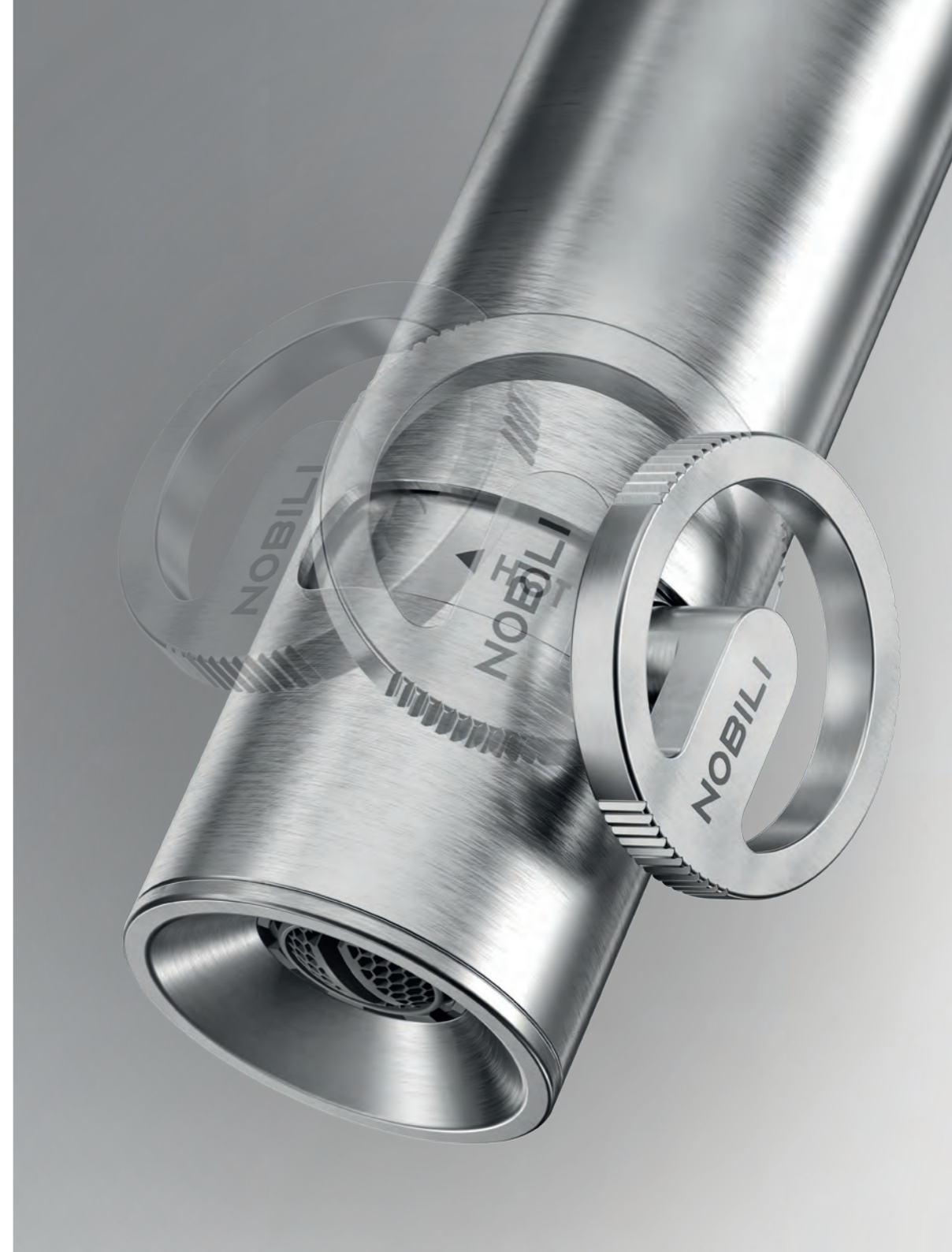
SO130118/31X Washbasin mixer