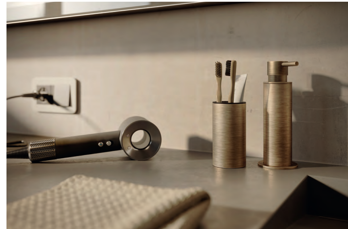
ACPL61SB Soap dispenser