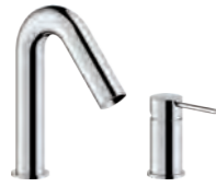
Remote control Comando remoto