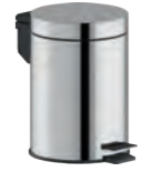
Waste bin with pedal Cestino con pedale