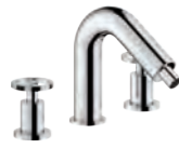
3-hole set Batteria 3 fori