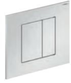
Wc plate Placca wc