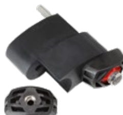
GKD 400 bis GKD 575 & GKD 650