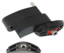
GKD 300 bis GKD 360