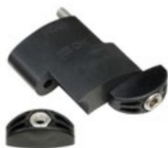
GKD 200 bis GKD 275